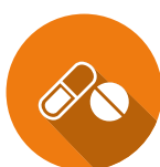
LES FRAIS MÉDICAUX