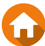
LES RESPONSABILITÉS CIVILES VIE PRIVÉE ET LOCATIVE