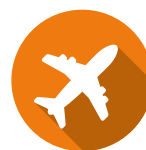
L'ASSURANCE PERTE ET VOL DE BAGAGES

Il ne vous reste plus qu'à choisir votre zone d'expatriation :