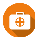
L'ASSISTANCE / RAPATRIEMENT